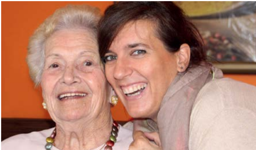
Kümmern sich Frauen um pflegebedürftige Angehörige, so sinkt ihre Beschäftigungswahrscheinlichkeit um 7,2 %.

Pflegen über 50-Jährige ihre Eltern, sinkt die Wahrscheinlichkeit, dass sie gleichzeitig berufstätig sind - bei Frauen um durchschnittlich bis zu 7,2 Prozentpunkte, bei Männern sogar um bis zu 11,8 Prozentpunkte. Frauen reduzieren zudem ihre Arbeitszeit um durchschnittlich 12,4 Prozent. Zu diesen Ergebnissen kommt eine aktuelle RWI-Studie zu den längerfristigen Folgen für die Arbeitsmarktsituation von Pflegenden. Sie basiert auf dem SHARE-Datensatz, der die Lebensverhältnisse von über 50-Jährigen in Europa und Israel erfasst.