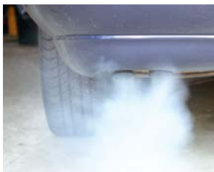
Dieselabgase können in Mäusen die Bildung von Amyloidplaques im Gehirn beschleunigen.

Wissenschaftler des IUF - Leibniz-Institut für umweltmedizinische Forschung in Düsseldorf konnten in Zusammenarbeit mit dem Niederländischen Institut für Volksgesundheit und Umwelt (RIVM) in Bilthoven und der Arbeitsgruppe für molekulare Psychiatrie an der Universitätsmedizin Göttingen zeigen, dass luftgetragene Schadstoffe aus dem Straßenverkehr in einem Mausmodell für die Alzheimer-Krankheit die Bildung der mit Alzheimer assoziierten Amyloidplaques beschleunigen und motorische Defizite verstärken.