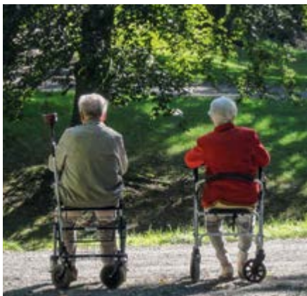
Schwatz im Grünen: Für ältere Menschen sind öffentliche Grünanlagen wichtig, weil sie dort zum Beispiel mit anderen Menschen in Kontakt kommen können.

Dass Stadtgrün wichtig ist für die Lebensqualität in Städten, ist längst eine anerkannte Tatsache. Weniger gut erforscht ist die Frage, welche Rolle Grünflächen für einzelne Bevölkerungsgruppen spielen. Unklar ist auch, wie grüne mit sozialer Infrastruktur verknüpft ist, welche Grünflächen zum Beispiel im Umfeld von Altersheimen zu finden sein sollten.