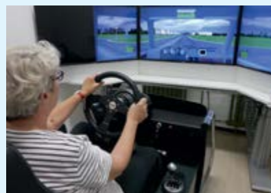
Das Fahrverhalten von Senioren untersucht eine Studie des IfADO in Dortmund.

Senior kracht mit PKW in Schaufenster – Schlagzeilen wie diese lesen wir immer wieder in der Zeitung. Dabei trifft dieses Negativeimage nur auf wenige Senioren zu. Der überwiegende Teil der älteren Autofahrer ist sicher unterwegs. Wie sich deren Fahrverhalten mit den Jahren entwickelt, wollen Forscher des Leibniz-Instituts für Arbeitsforschung (IfADO) in Dortmund zusammen mit dem Umfragezentrum Bonn analysieren. In den nächsten fünf Jahren untersuchen sie in regelmäßigen Abständen das Fahrverhalten von Senioren, um mögliche Veränderungen in der Fahrtüchtigkeit zu verstehen sowie potenzielle Risikofaktoren für die Altersgruppe zu identifizieren. Dies soll dazu beitragen, die Mobilität älterer Menschen so lange wie möglich zu erhalten und deren Sicherheit im Straßenverkehr zu erhöhen.